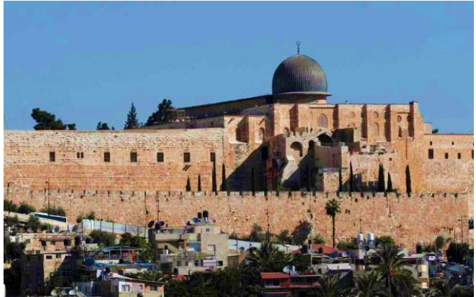
Gambar 2: Masjid al-Aqsa

dikenali sebagai tahun kesedihan. Melalui peristiwa agung ini juga, Baginda SAW menerima perintah daripada Allah SWT untuk mengerjakan solat lima waktu sehari semalam. Perintah ini diturunkan secara langsung oleh Allah SWT kepada Baginda SAW tanpa adanya perantaraan Malaikat Jibril AS.