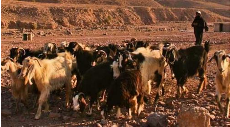
Gambar 4: Mengembala Kambing Adalah Pekerjaan yang Mulia, kerana Ia Adalah Sunah Nabi Muhammad SAW

Baginda SAW tidak menyertai rakan-rakan sebayanya dalam kalangan remaja Mekah dalam bersuka ria dan berfoya-foya. Allah SWT telah memelihara Baginda SAW daripada terlibat dalam gejala tersebut. Kitab-kitab sirah menceritakan dengan panjang lebar, semasa usia remaja, Baginda SAW terdengar suara nyanyian daripada salah sebuah rumah di Mekah sempena majlis perkahwinan dan Baginda SAW teringin untuk menyaksikannya akan tetapi Allah SWT menjadikan Baginda SAW tertidur dan hanya terjaga setelah matahari panas terik. Baginda SAW juga tidak terlibat bersama kaumnya menyembah berhala, makan sembelihan untuk berhala, minum arak dan bermain judi. Baginda SAW juga tidak pernah bercakap kasar dan berkata kesat.