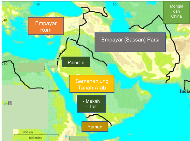
Gambar 1: Gambaran Peta Kawasan Timur Tengah pada Abad Keenam

khurafat dan dongeng yang tidak memberi faedah dan kesan yang baik. Negara India pula pada waktu itu berlaku kemerosotan agama, akhlak dan kemasyarakatan.