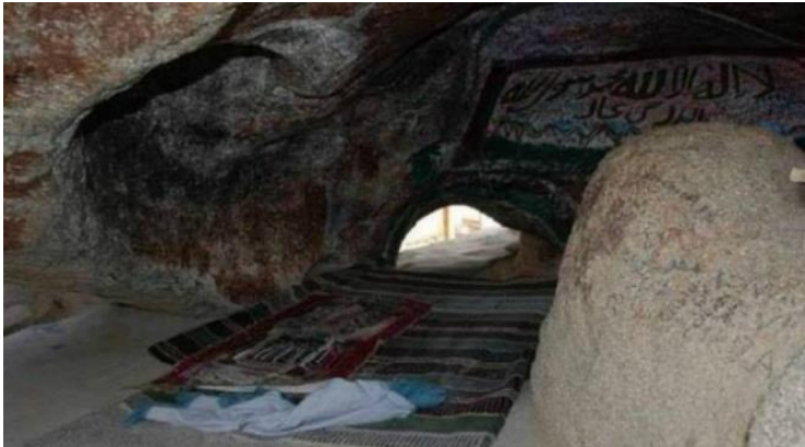
Gambar 3: Gua Hira

Maksudnya: Bacalah (wahai Muhammad) dengan nama Tuhanmu yang menciptakan (sekalian makhluk) (1) Ia menciptakan manusia daripada sebuku darah beku; (2) Bacalah, dan Tuhanmu Yang Maha Pemurah,- (3)