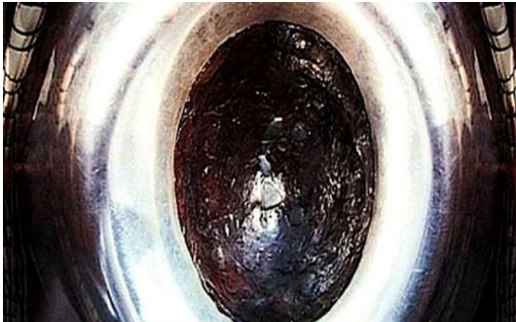
Gambar 5: Hajar Aswad

menyebabkan dindingnya retak. Oleh itu, penduduk Mekah membuat keputusan meruntuhkannya dan memperbaharui binaannya. Mereka melaksanakan keputusan itu. Namun, apabila pembinaan sampai ke peringkat meletak Hajar Aswad ke tempat asalnya, mereka bertengkar tentang siapakah yang akan mendapat penghormatan untuk meletak Hajar Aswad ke tempatnya. Setiap kabilah ingin mendapat penghormatan itu. Pertelingkahan bertambah hebat sehingga mereka saling mengancam untuk berperang. Kemudian mereka bersetuju untuk merujuk kepada orang pertama yang memasuki pintu masuk Bani Syaibah (salah satu pintu Masjidil Haram) sebagai hakim.